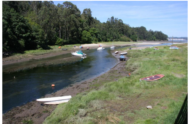
1-Desembocadura do Lambre na Ponte do Porco. O río Lambre nace no Monte da Pena da Uz (Monfero) e desemboca na Ponte do Porco na ría de Betanzos facendo de linde entre os concellos de Paderne e Miño.