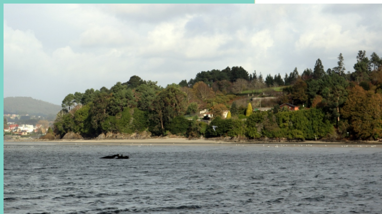
Punta Xurelos (banda sur)