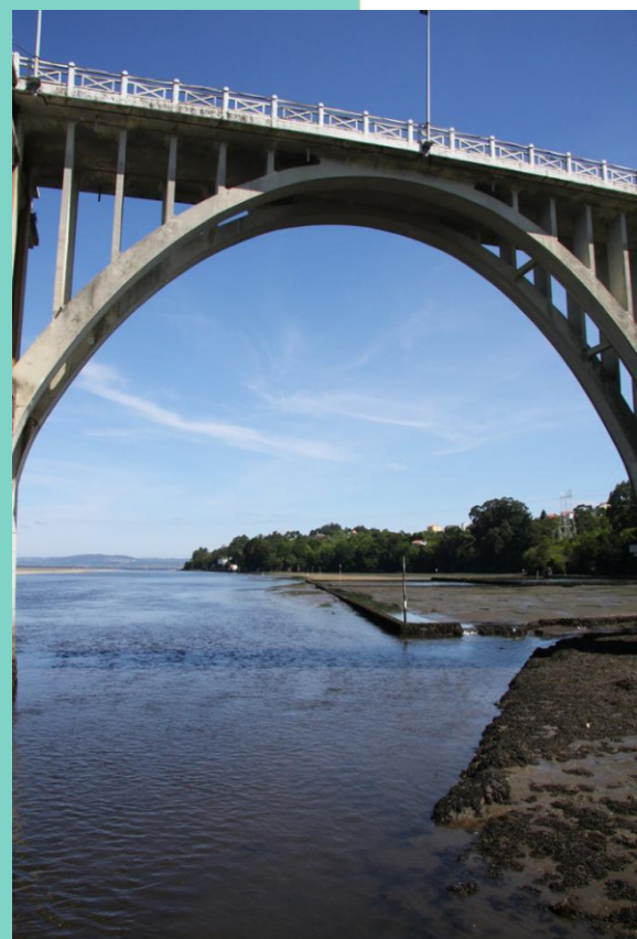
5-Ria de Betanzos desde Ponte Pedrido, na desembocadura do Mandeo, o río principal que alimenta a ría de Betanzos.