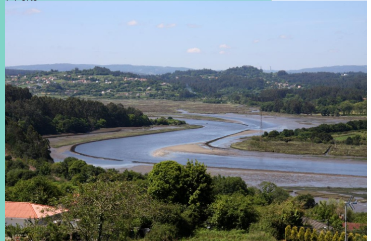
8-Esteiro do Mandeo.

O río Mandeo nace no Marco das Pías (Sobrado dos Monxes) e desemboca na ría de Betanzos formando un amplo esteiro. O tramo final do río conserva unhas extensas marismas de enorme riqueza biolóxica.