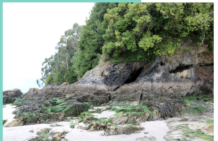
Punta Xurelos (banda norte)