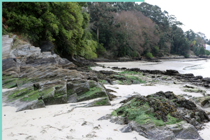
4-Praia Xurela. Praia moi abrigosa e tranquila na que antes se recollía moito berberecho, longueirón, mexillón, mincha e en menor cantidade ameixa.