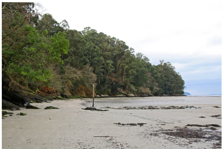
2-Praia da Abeleira, no esteiro do río Lambre. Coa marea baixa forma un extenso areal que se une á praia Xurela e polo que se pode camiñar.