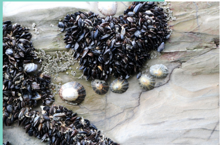
Mexillóns e lapas