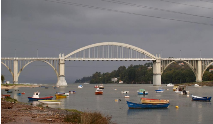
6-Ponte do Pedrido sobre a desembocadura do Mandeo, entre os concellos de Bergondo e Paderne.