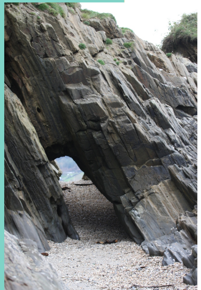
Punta Xurelos (banda norte)