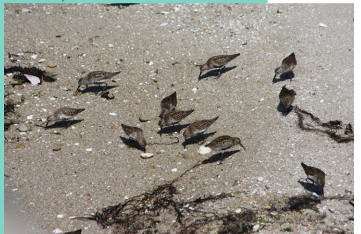
Pilro curlibico ( Calidris alpina )